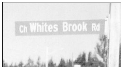
(Panneau routier, Oak Point, N.-B.)

(à gauche : Le White Brook , un ruisseau nommé en mémoire d'un de nos ancêtres, Ned LeBlanc)